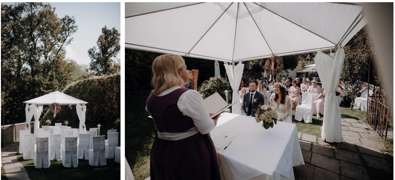
Trauung im Garten