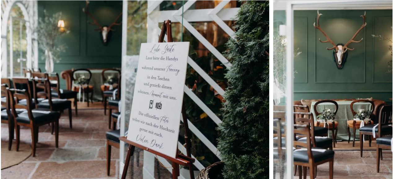
Standesamtliche Trauung im Salettl