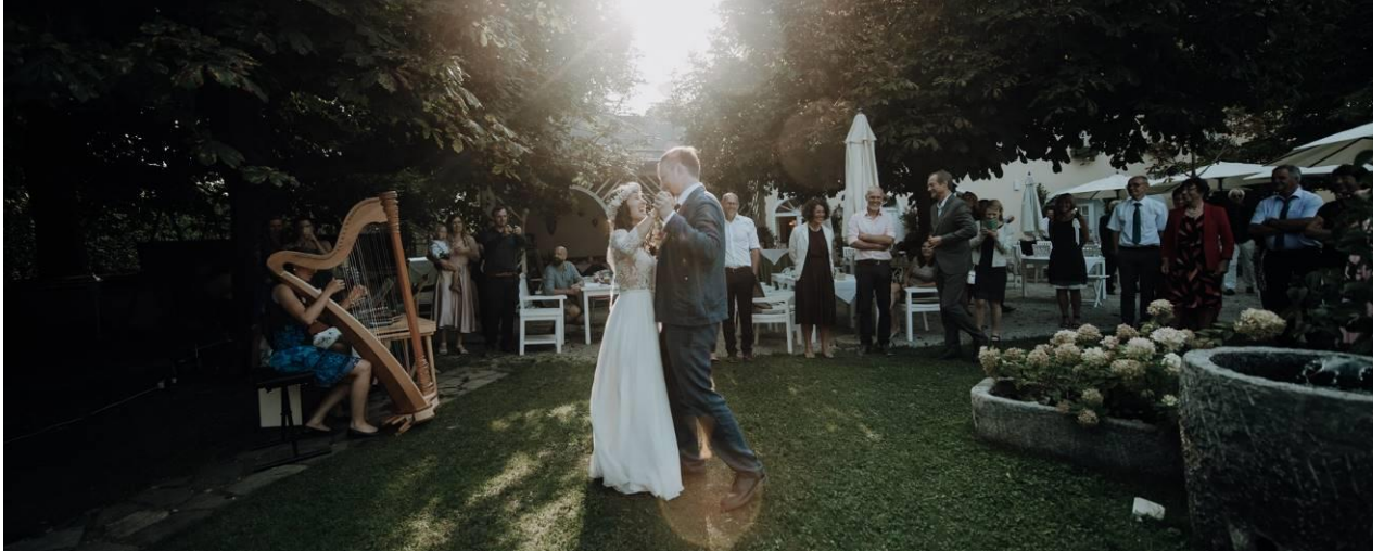
Schlosswirt Garten